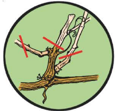
Zapfenschnitt in den Folgejahren